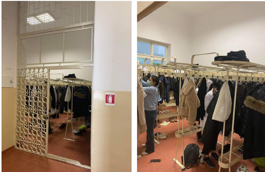
Imaginea 4. Vestiarul anacronic de la Medicală II

Totuși, ca să fim corecți, majoritatea vestiarelor nu sunt atât de neîncăpătoare ca și cele de la Medicală III. Probabil cel mai sugestiv este vestiarul de la Medicală II, care are un spațiu de aproximativ 20m 2 și care este folosit la comun. Acest spațiu, de exemplu, s-ar preta renovării și transformării într-un vestiar limitat doar pentru bărbați sau femei, urmând ca pentru celălalt sex să se identifice alt spațiu pretabil.