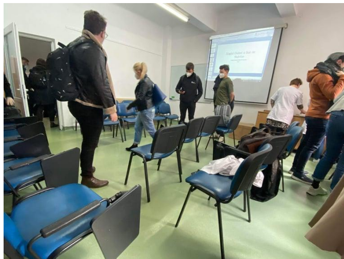
Imaginea 2. Studenți folosind sala de curs pentru a se schimba în haine de clinică

Alte spitale universitare din oraș, cum ar fi Spitalul de Pediatrie II sau Clinica de Ortopedie-Traumatologie au renunțat total la vestiarele pentru studenți, aceștia fiind nevoiți să folosească la comun amfiteatrul. Acesta este cazul și la Clinica de Diabet din cadrul Spitalului Clinic Județean de Urgență Cluj-Napoca.