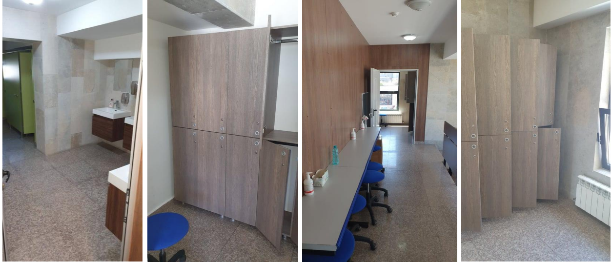
Imaginea 5. Vestiarul modern de la Spitalul Municipal (Medicală V)

Se poate observa cum, în urma intervenției unui proiectant s-a găsit suficient spațiu pentru construcția de vestiare noi, deși este vorba de un spital vechi renovat. Se demontează astfel argumentul cel mai des utilizat pentru conservarea stării de fapt și anume că "nu se poate face nimic până nu se construiesc spitale noi de la zero". Deși, este de necombătut că aceasta este soluția optimă, se pot realiza îmbunătățiri rapide cu costuri relativ mici la beneficiile câștigate atât pentru studenți, cât și pentru pacienți.